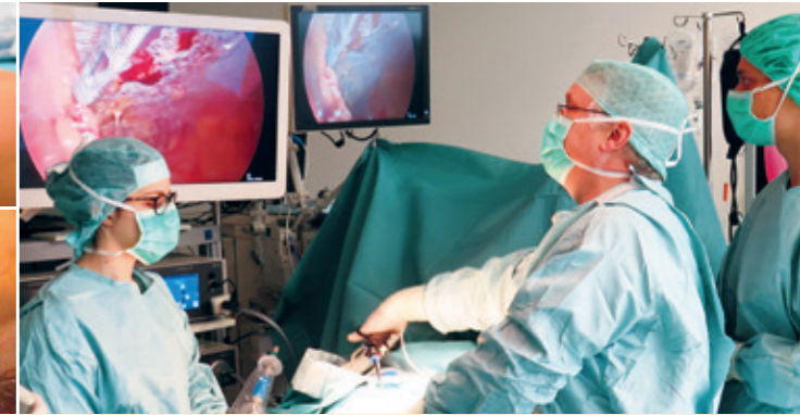
Minimal Invasive Chirurgie im high-Tech Operationssaal