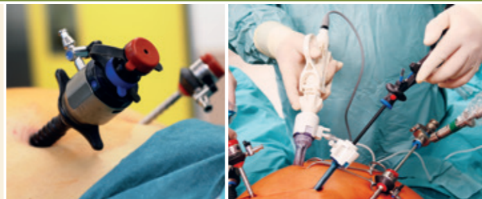
Minimal Invasive Chirurgie: kleine Schnitte – große Wirkung