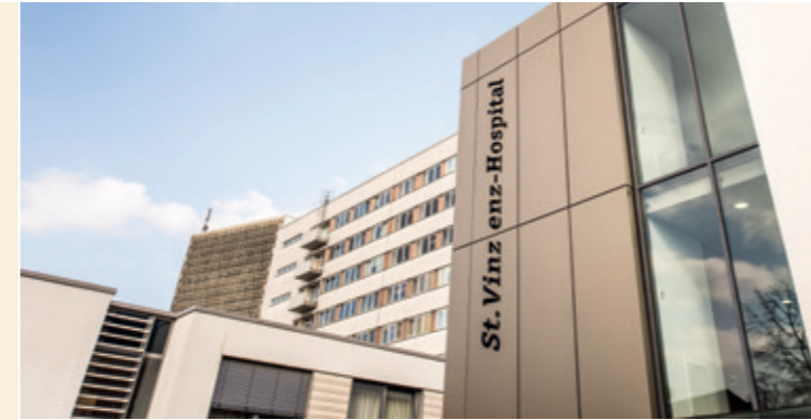
Das St. Vinzenz-Hospital in Dinslaken

Koloproktologische Sprechstunde Erkrankungen des Anal- und Mastdarmbereichs, Mast- und Dickdarmspiegelungen Di 13.00 Uhr und nach Vereinbarung