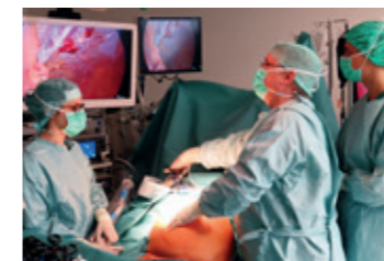
Minimal Invasive Chirurgie im high-Tech Operationssaal

Wir führen nahezu alle Operationen in minimal invasiver Technik in unseren neuen High-Tech-Operationssälen mit speziell auf die Adipositas ausgerichteten Instrumentarium durch. Die laparoskopische Chirurgie ist deutlich weniger belastend als die offene Chirurgie, da hier auf große Schnitte verzichtet wird und stattdessen nur kleinere Einstiche vorgenommen werden.